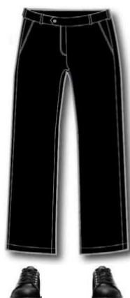
Pantalons / culottes courtes / jupes noirs

Chronométreurs et chronométreurs en chef